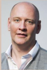
Jan Honsel Pinterest